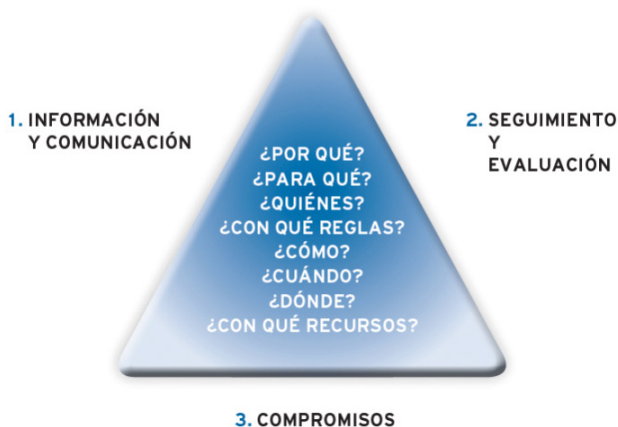
Imagen 1. Modelo 8+ 3 EUDEL

El modelaje, pretendidamente objetivo, también se aprecia en los manuales producidos por las federaciones de municipios que proponen modelos propios de implementación rápida y prescriptiva de procesos de participación. Estos modelos (cf. imágenes 1, 2 y 3) se presentan sin mención de sus condiciones de producción (quién, cómo, cuándo lo ha producido) y conviven a la vez que compiten entre sí.